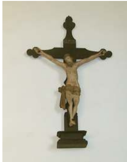
Kruzifix der Groß Elber Kirche