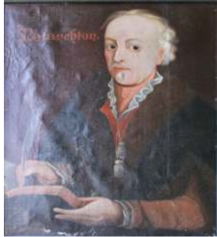
Bild von Philipp Melanchthon aus der Groß Elber Kirche

Luther arbeitete unermüdlich an der neuen Theologie, doch ohne Systematik. Dies übernahm Melanchthon: Er schrieb 1521 die erste gültige Zusammenfassung der reformatorischen Lehre „Loci Communes“. Am Reichstag in Augsburg (1530) konnte Luther wegen des verhängten Banns nicht teilnehmen. Deshalb vertrat Melanchthon die Sache der Reformation und meisterte die schwierigen Verhandlungen mit den vom Kaiser und Rom betriebenen „Religionsgesprächen“. Er erwies sich als geschickter Vermittler. Ein „Brückenbauer“, der auch kluge Kompromisse einging. Das brachte ihm nicht nur Freunde ein - Luther jedoch, war zufrieden. Melanchthon verfasste im Anschluss der Verhandlungen das große Bekenntnis der Reformation: „Das Augsburger Bekenntnis“ – sein Meisterstück, das noch heute zu