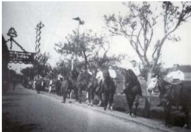
Ehrensplazier an der heutigen B6 bei Klein Elbe