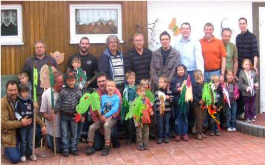
Vatertag im Kindergarten Gustedt. Drachenbau war sehr beliebt.

Am 29. Juni findet unser traditionelles Seniorenfrühstück statt. Wir laden alle Senioren herzlich ein. Für das Frühstück entsteht ein Kostenbeitrag von 2,50 Euro. Bitte melden Sie sich im Kindergarten an.