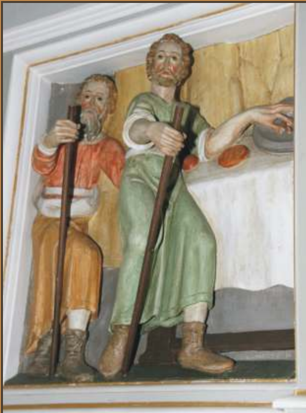
Ausschnitt aus dem Altar der Nikolauskirche in Klein Elbe "Im Glauben unterwegs"