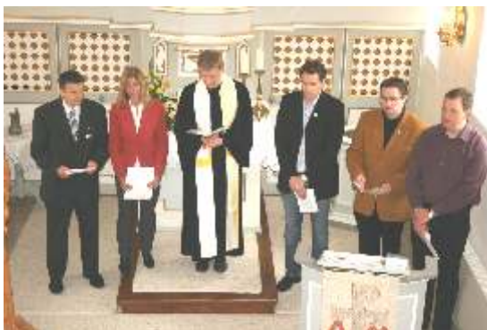
Fürbittengebet unter Beteiligung des Vorstandes