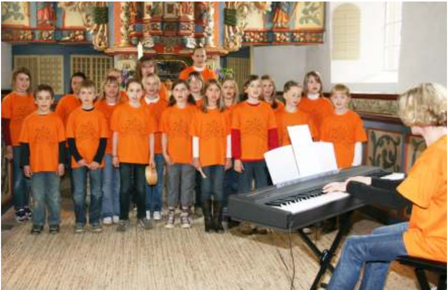
Die Chor'n Flakes bei ihrem ersten großen Auftritt in der Martinskirche Groß Elbe