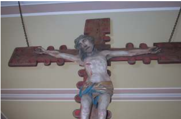
Kruzifix der Gustedter Kirche

Übersetzung der neuen Zürcher Bibel. Die Verurteilung und die letzten Stunden Jesu, sowie sein Tod am Kreuz und die Grablegung waren in klarer, eindringlicher Sprache geschrieben. Die Zürcher Bibel will so wenig wie möglich interpretieren, damit Schwieriges nicht banalisiert und Erschreckendes nicht beschönigt wird. Durch die abwechselnde Lesung begannen die Bibelszenen zu atmen. Wir wissen alle, wie die Geschichte ausgeht. Und doch keimte kurz die Hoffnung, dass es diesmal anders sein werde, dass sich die aufgeregte Menge bei der Verurteilung beruhigen ließe und die missgünstigen Richter anders entschieden, damit Jesus nicht den Kreuzestod sterben müsse. Es gab so viele Menschen in den unterschiedlichsten Situationen, die dies hätten verhindern können, und doch hat es keiner getan. Es läuft nahezu geradlinig auf die Hinrichtung zu.